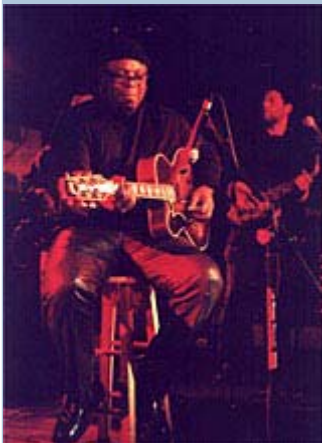
The Masters of Groove