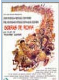
Golfus de Roma