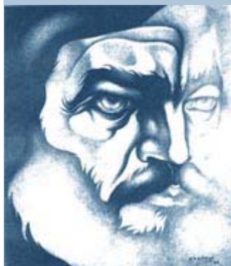
20 Años sin Cortázar