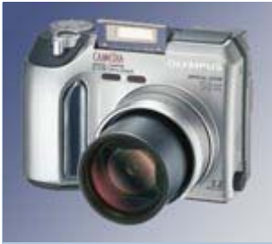
Escuela de fotografía