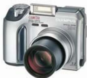
Un día en la UCA

CONCURSO DE FOTOGRAFÍA UN DÍA EN LA UCA . Se abre el plazo de inscripción a este concurso abierto a toda la Comunidad Universitaria.