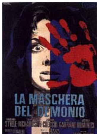
La máscara del demonio