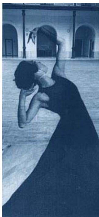
Escuela de Danza

CAMPUS CINEMA ALCANCES: BUEN VIAJE, EXCELENCIA. (V.O.). Dir.: Albert Boadella. España. 2003. Entrada: 3 euros. / Comunidad Universitaria: 1,5 euros.