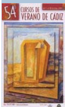
Cursos de Verano

Jueves, 1. 21.00 horas. Aulario La Bomba.