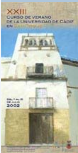
Cursos de Verano San Roque