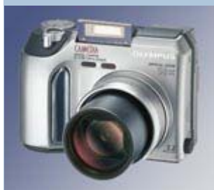
Escuela de fotografía